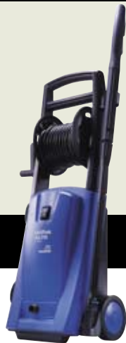
▲ C 120.1-10 X-TRA