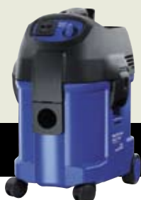
▲ CENTIX 60 CENTIX 60 PREMIUM