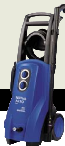
▲ P 150.1-10 B

A Nilfisk-ALTO PRO sorozat kiváló teljesítményt kínál, és alkalmas a ház körüli nagyobb tisztítási feladatokra, valamint félprofesszionális használatra.