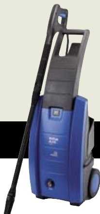
▲ C 120.2