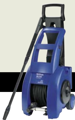
▲ E 135.1-10