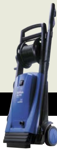
▲ E 140.1-9 S X-TRA