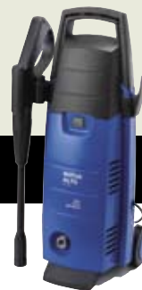
▲ C 110.1 X-TRA

A Nilfisk-ALTO COMPACT sorozat tipikus házkörüli tisztítási feladatokra alkalmas, mint pl. járólapok, lépcsők és járművek mérsékelt gyakoriságú tisztítása.