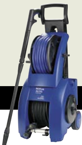
▲ E 145.1-15 S X-TRA