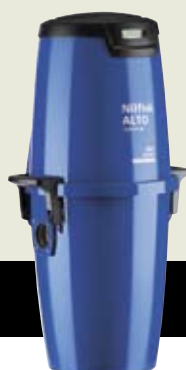
▲ CENTIX 50 PREMIUM