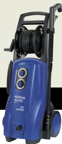
▲ P 160.1-15 X-TRA