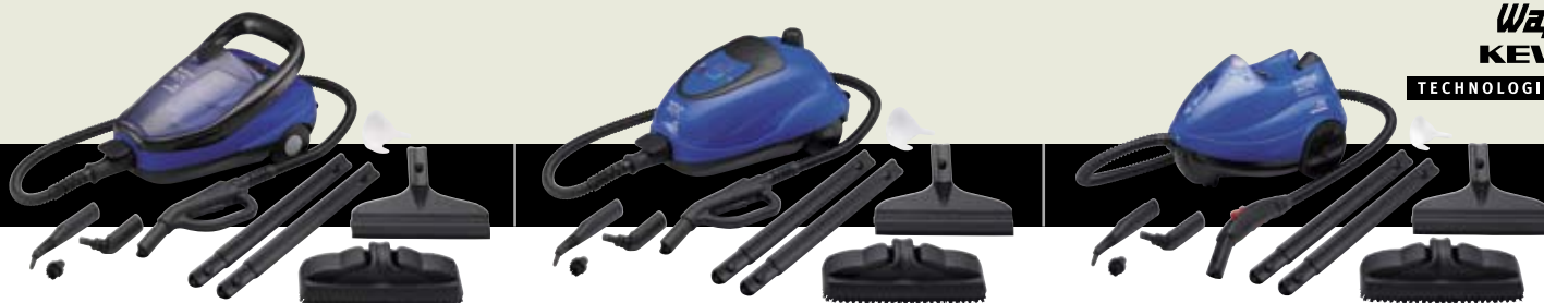
▲ STEAMTEC 5 IH