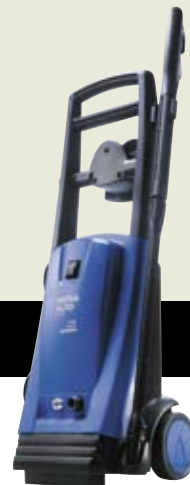
▲ E 130.1-8