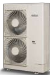
altherma™ HT ERRQ kültéri egység