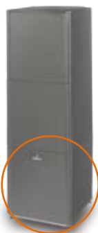
EKHBRD altherma™ HT beltéri egység EKHTS használati melegvíz tartállyal