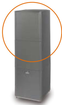
EKHBRD altherma™ HT belső egység EKHTS használati melegvíz tartály